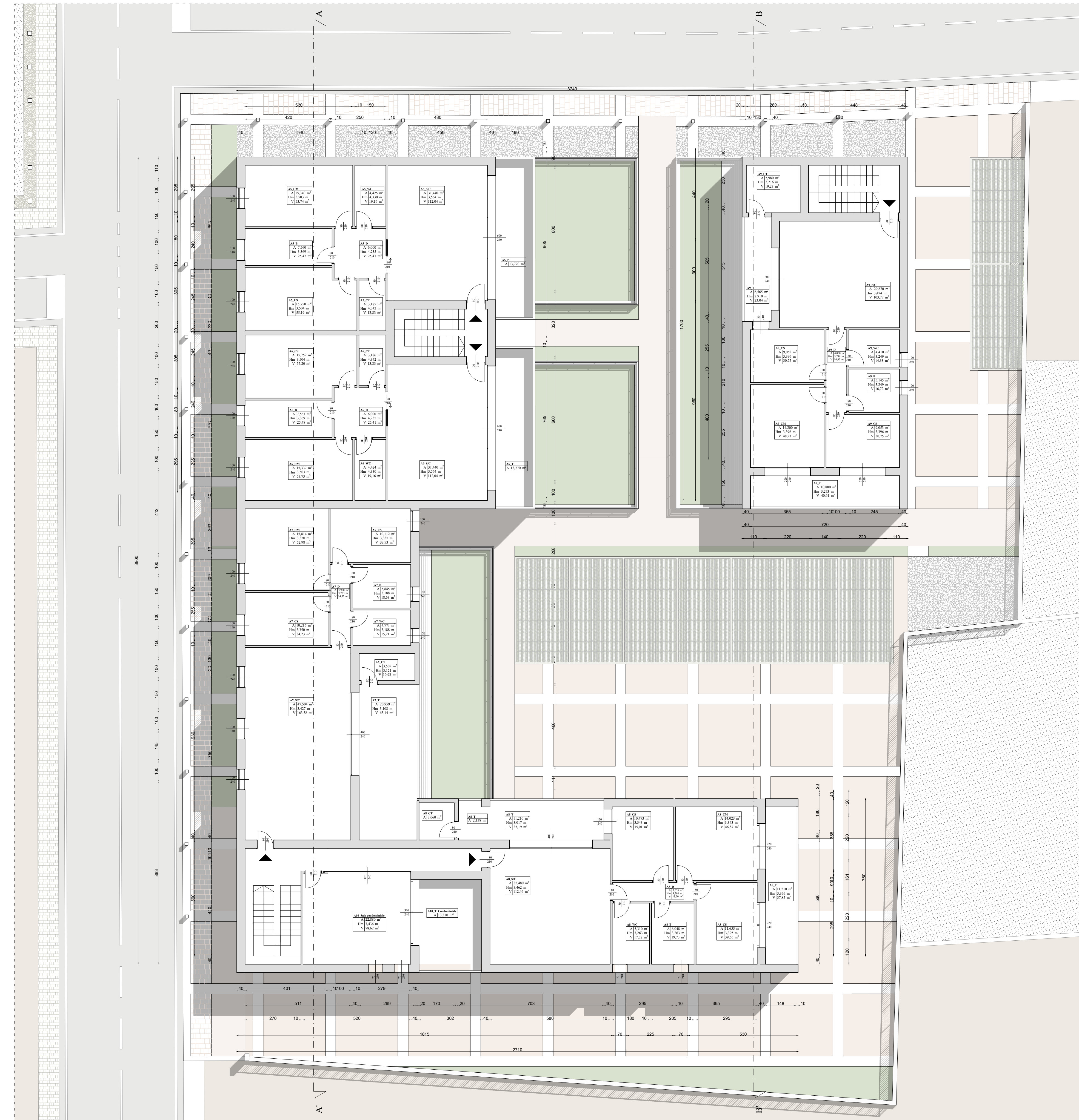
PIANTA PIANO PRIMO scala 1:100